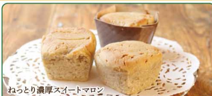
ねっとり濃厚スイートマロン

会津栗園 純生クリームとフレッシュバター、卵黄、べこの乳を純栗 に合わせ焼き上げたスイートマロン。 1個 300円税込