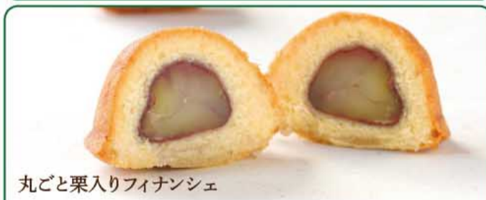
丸ごと栗入りフィナンシェ

会津栗の栗蒸し羊かん どこを切っても栗がごろごろ入った、もちり羊かん。 1本 1,188円税込