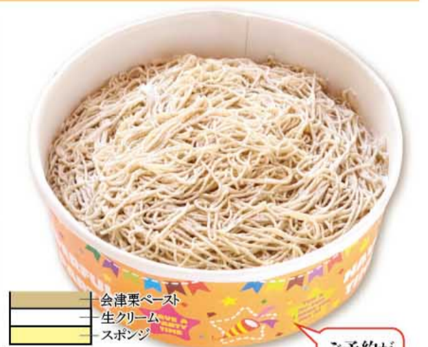
会津栗ペースト 生クリーム スポンジ

会津栗園 純生クリームとフレッシュバター、卵黄、べこの乳を純栗 に合わせ焼き上げたスイートマロン。 1個 300円税込