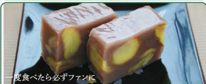
一度食べたら必ずファンに

会津栗の栗蒸し羊かん どこを切っても栗がごろごろ入った、もちり羊かん。 1本 1,188円税込