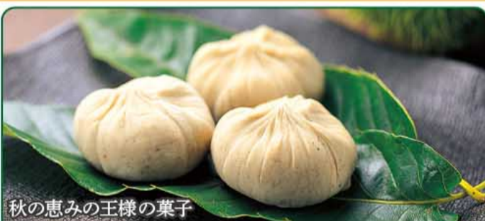
秋の恵みの王様の菓子

とれたての鮮度の高い栗を自社工場ですぐに加工しています。太郎庵の会津栗はいろんな感謝と誇りでできています。