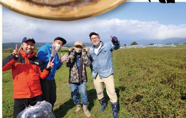
喜多方市塩川のピーナッツ畑での収穫

ピーナッツのブランド品種『ナカテユタカ』は会津の土地だと大粒で油分が多く育つそう。収穫後は1粒1粒 手剥きされています。手剥きは実に傷が付きにくくオイルが漏れない為、美味しさを長く保てます。