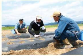
喜多方市塩川のピーナッツ畑

ピーナッツのブランド品種『ナカテユタカ』は会津の土地だと大粒で油分が多く育つそう。収穫後は1粒1粒手剥きされています。手剥きは実に傷が付きにくくオイルが漏れない為、美味しさを長く保てます。