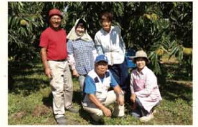
特別契約栽培栗園の皆様

太郎庵では特別契約栽培栗園で採れる高品質な会津栗を使っています。社員と共に土壌作りから始め、生産者様の努力で今年も豊かに実を結びました。